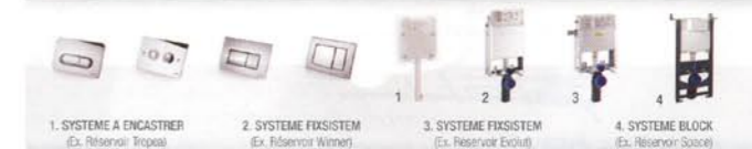
1. SYSTEME A ENCASTRER (Ex. Réservoir Tropical) 2. SYSTEME FIXSYSTEM (Ex. Réservoir Winner) 3. SYSTEME FIXSYSTEM (Ex. Réservoir Evolut) 4. SYSTEME BLOCK (Ex. Réservoir Space)

VALSIR S.p.A. Località Merlaro, 2 - 25078 Vestone (Brescia) Italy Tel. +39 0365 877011 - Fax +39 0365 870820 Info: valsir@valsir.it - www.valsir.it